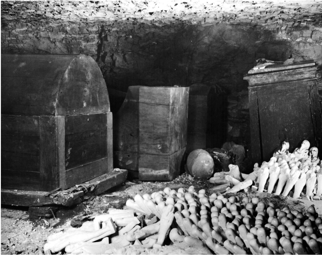
▲ 255. Saqqara. Une des salles de la tombe de Kanefer telle qu'elle se présentait lors de son ouverture (1949)

256. Saqqara. À l'ouverture de l'un des cercueils apparaît cette momie. Un masque doré dissimule son visage. Un cartonnage simulant un large collier recouvre sa poitrine. Des perles éparses laissent imaginer la résille qui recouvrait jadis le linceul. Des amulettes protectrices avaient été glissées par les embaumeurs entre les bandelettes, elles sont méticuleusement rassemblées (1949) ►