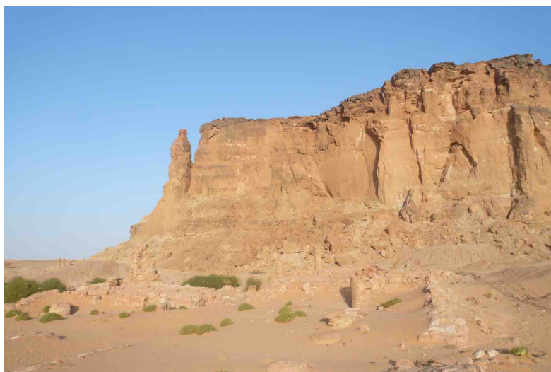
Gebel Barkal

Massif rocheux tabulaire se détachant de la plaine désertique de Nubie, La Montagne Pure du Gebel Barkal s'élève sur la rive droite du Nil et surmonte de ses quelque 90 mètres les vestiges de temples et de palais édifiés par les souverains de Kouch aux époques napatéenne et méroïtique. C'est pourtant aux pharaons du Nouvel Empire que l'on doit la mise en valeur du site en inaugurant, à plus de 1000 km au sud de Thèbes, un programme de construction de temples dédiés à une forme spécifique d'Amon Maître des Trônes des Deux-Terres. De ce moment, La Montagne Pure s'est enrichie d'une valeur particulière, celle d'une butte primordiale habitée par une forme originelle du dieu Amon, fertile et créateur. Le Gebel Barkal est en outre flanqué d'une aiguille rocheuse, le pinacle, dont la silhouette évoquerait l'uræus, la déesse protectrice de son père et de la royauté terrestre.