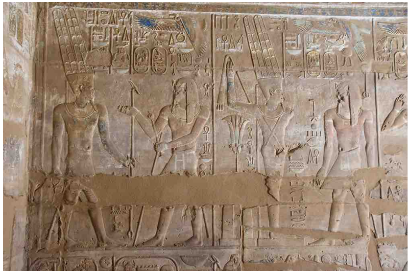
Alexandre le Grand devant le dieu Amon

Tant la personne d'Alexandre que celle d'Auguste évoquent pour l'Égypte le début de la nouvelle ère. Les deux conquérants ont chacun mis en place une nouvelle dynastie dont les souverains allaient régner sur l'Égypte en tant que Pharaon, responsable du contact avec les dieux et de la prospérité du pays.